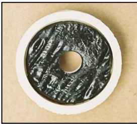
〈黒いブチルゴム面〉 山留側もしくは水の浸入側