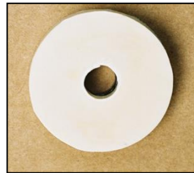
〈白い天然ゴム面〉 手前側もしくは出水方向